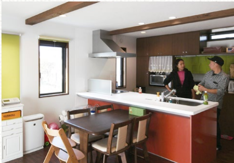
家族との会話を弾むアイランド型キッチン

1階には間仕切りが無く、家具での仕切りで視線を遮っております。また回遊性のある動線を持たせることで、コンパクトながらもとても使いやすい住まいになりました。