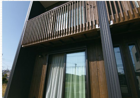
袖壁が斜めの風も室内に誘導します