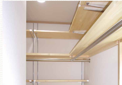
自由に可変できる収納棚は、より効率的な収納が可能