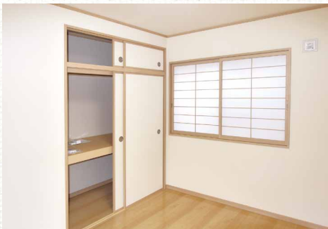
洋室に障子を取り入れることで、独特の空間が生まれました