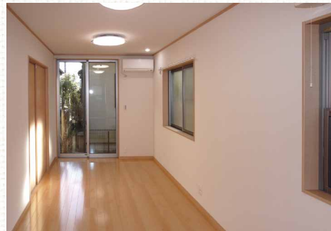
照明は全室LED、内壁には珪藻土クロスを使用しました