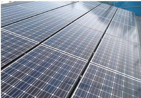
太陽光発電システムの導入により、光熱費の削減に貢献

日中の高い売電効果と照明を全室LEDにすることで、省エネ効果の高い住宅になりました。